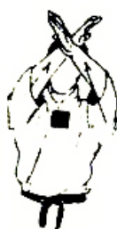
JODAN JUJI UKE